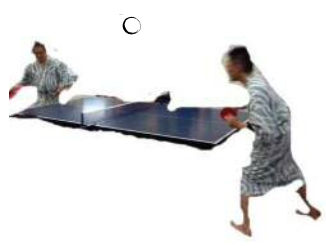
軽い運動は生活習慣病予防や脳の活性化に良い

私も健康の為に毎日ワッスルのお弁当を食べていますが、お菓子を間食で食べてしまったり。少しだけならいいだろうと思いつつ、毎日食べて、気付いたら正月あけから4キロも太ってしまいました。ほんのちょっとしたことですが、今年の決意として、 ①お菓子を我慢する ②少し運動をします！