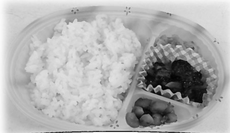
作りたての朝食弁当をお届けします☆

『朝はパンではなく、出来たてのごはんを食べたい。』 『朝食も含めて栄養管理をしたい。』など、 朝食でお困りの方は、ぜひ一度お試しください。