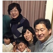
久しぶりに 実家の母と