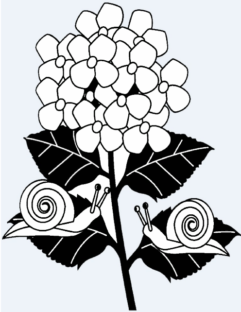
あじさいとかたつむり