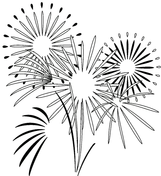
夜空に咲く大輪の花