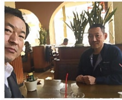
御津町の 明るい未来！ 鶴ヶ崎鉄工さんと