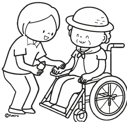
日焼け止めを忘れずに☆