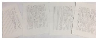
生徒さんとお手紙！

終わって数日後に、生徒さんからお手紙が届きびつくりしました。感謝の内容が綴られていましたが、こちらもはじめのことととてもうれしかったです。うちに来てくれればと思います。が、世間は人手不足なので競争が激しく難しいかな？十一月には、