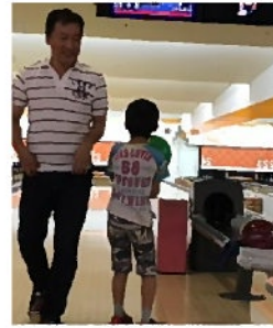
息子とボーリング