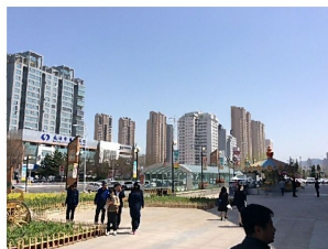
高層ビルが立ち並ぶ 威海市！