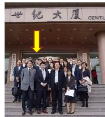
中国政府のビル 前にて