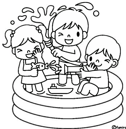
たのしい水あそび