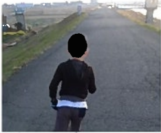
豊川の堤防を 息子と朝ラン！

共働きが当たり前の時代になり、出産育児がますます大変な時代となるなかで、配食サービスで育児をお手伝いします。といましても、在宅向けではなく、児童施設への配食です。豊川市民病院内の保育園「ほいっぽ」さんへ四月より