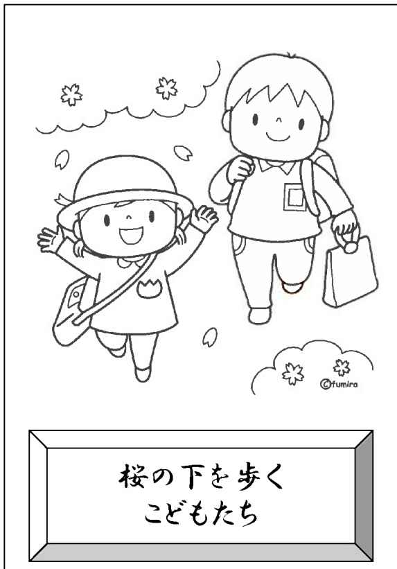
桜の下を歩く こどもたち