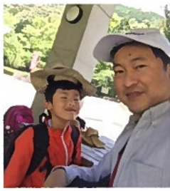
愛知県民の森にて

みなさんお元気ですか。店長のがみです。「二兎を追う者は一兎をも得ず」とは、欲を出して同時に二つの事をうまくやろうとすると、結局はどちらも失敗することのたとえですが、これに当てはまらない大活躍をする人が現れてびっくりにしています。