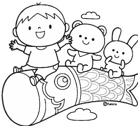
こいのぼりと こどもたち

ぬり絵でマニキエイジング！ ぬり絵をするこ、脳が活性化され、 認知症等の予防に効果があるそうです。 レッツトライ！