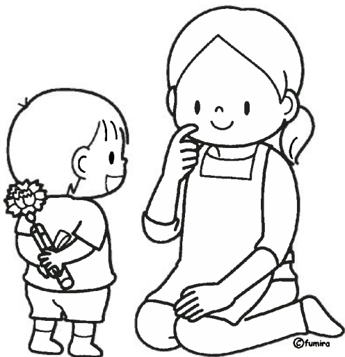
カーネーションを渡す 男の子とお母さん