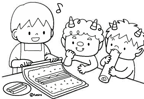
恵方巻きを作ろうね

ぬり絵をするこ、脳が活性化され、 認知症等の予防に効果があるそうです。 レッツトライ!