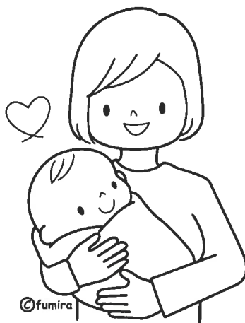
あかちゃんとお母さん

ぬり絵でマンチエイジング！ ぬり絵をすることで、脳が活性化され、 認知症等の予防に効果があるそうです。 レッツトライ！