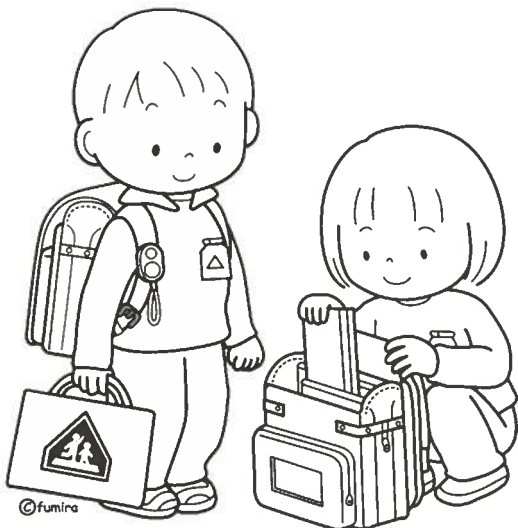
ランドセルとこども