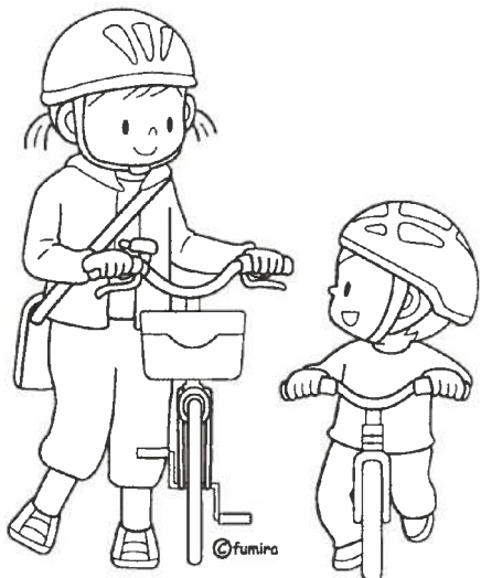
自転車に乗る 子ども