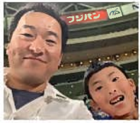
名古屋ドーム で長男とドゥ応援!

みなさんお元気ですか!店長のがみです。私たちの宅配弁当は普通食のタンパク質を増量しました。これにより筋肉低下を防ぎ、寝たきりを防止して、健康で長生きすることを助ける事ができます。 日本の平均寿命は毎年更新されており、二〇一七年で女性が87.26歳、男性が81.09歳で女性は香港に次いで二位、男性は香港スイスに次いで三位となっています。人間だけでなく、ペットの犬の平均