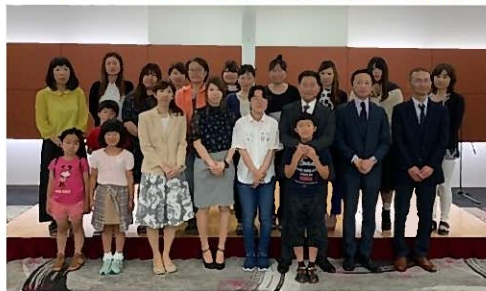
第8期 方針発表会にて