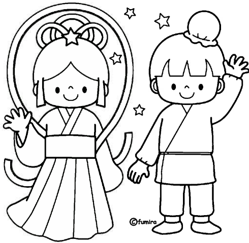
おりひめ・ひこぼし

ぬり絵をすることで、脳が活性化され、 認知症等の予防に効果があるそうです。 シットトライ！