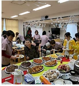
ティサービスでハイキング実施!

新年明けましておめでとございます。本年もどうぞよろしくお願ひ致します! 令和元年は激動でしたね。私個人の5大ニュースは、 ⑤消費税アップ ④香港デモ ③台風19号 (過去最大) ②ラグビーワールドカップ日本ベスト8 ①米津玄師の大ブレイクです。 いろいろとありましたが、特に①の米津