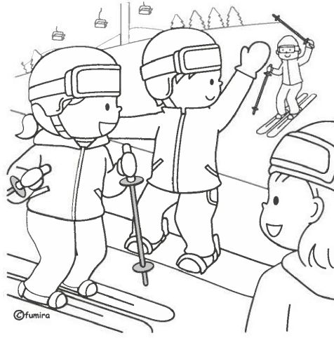
スキーをする家族