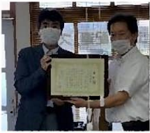
おかげさまで 月間 2 万食達成!

最近うちの子供が夢中になっているアニメがあります。「鬼滅の刃」(きめつのやいば)といって、大正時代の日本に人食い鬼がおり、家族を