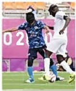
ブラインドサッカー

皆さんお元気ですか。四度目の緊急事態宣言は発令されました。感染者数は八月二十七日に二千三百人以上となり過去最高を更新しました。 ワクチンも副反応がつよいといわれる二回目をうちましたが、副反応は出なかつたので良かったです。ワクチンを打つと重症化しないといわれているのでこれで一安心です。 さて、オリンピックもおわり、パラリンピックが始まりました。