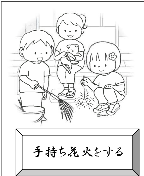
手持ち花火をする