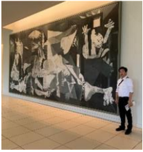
大塚国際美術館 ゲルニカ前にて

みなさんおげんきですか。高齢ドライバーによる事故が増加しているといわれています。去年発生した七五歳以上の高齢ドライバーの死亡事故は三三四件と三年前より五〇件以上増加しています。ブレーキとアクセルを間違えたことによる事故がほとんどだそうです。