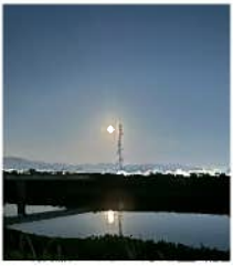
豊川放水路の 満月がきれい！

みなさんおげんきですか。外気温が40度を超える異常な暑さですが、体調を崩さないようご注意ください。ね。異常な暑さの原因が地球温暖化によるものであるといわれています。地球が壊れていって、もとに戻らないのではないかと考えてしまいます。