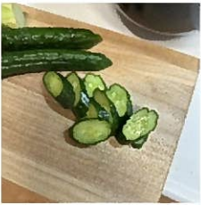
ぬかづけで 体調ばっちり！

みなさんおげんきですか。徐々に春のおとすれを感じるようになりました。最近、ぬか漬けの乳酸菌が腸にいいと知ったので、無印良品で発酵ぬか床を買ってきて、胡瓜や人参をつけて食べています。元々、漬物が苦手なで、健康のために我慢しながら食べていました。が、いつの間にかごはんがすすむおかずの一品となり楽しみの一つになりました。